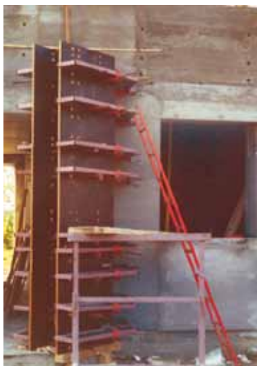
Debnenie pre ubíjanú stenu.