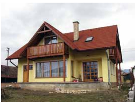
Dom z ubíjanej hlíny.