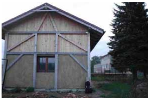
Pohľad na zateplenú a omietnutú budovu Ekocentra SOSNA